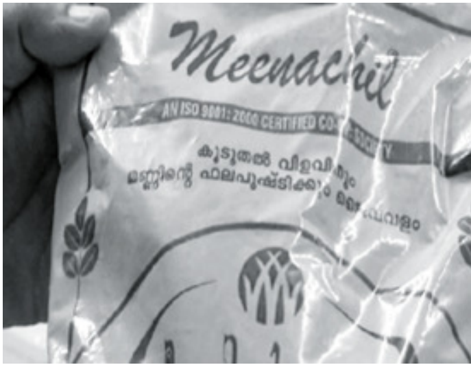
ജൈവവളമെന്ന പേരിൽ വിൽക്കുന്ന കമ്പനിയുടെ ഖരമാലിന്യം

⇒ കേന്ദ്ര പരിസ്ഥിതി മന്ത്രാലയമോ കാർഷിക സർവ്വകലാശാലയോ അല്ല അക്കാദമിയിൽ സർട്ടിഫിക്കറ്റ് നൽകേണ്ടത് ⇒