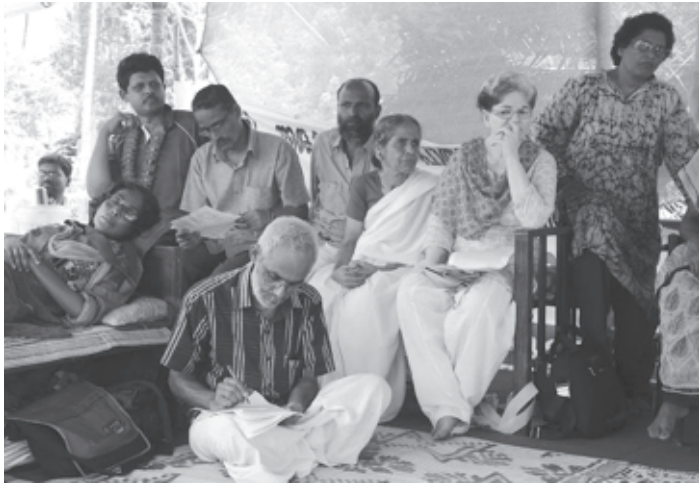
പാലിയേക്കര ബി.ഒ.ടി ടോൾ വിരുദ്ധ സമരപന്തൽ

⇒ സോളിഡാരിറ്റിയോടുള്ള എന്റെ രാഷ്ട്രീയ വിധേയത്വം സ്വതന്ത്രരാഷ്ട്രീയവുമായി ബന്ധപ്പെട്ടതാണ് ⇒