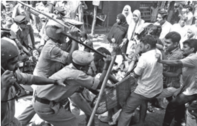
കിനാലൂരിലെ പോലീസ് ലാത്തിച്ചാർജ്ജ്

അത്തരം പ്രവർത്തനങ്ങളോട് എനിക്ക് അഭി പ്രായഭിന്നതയില്ല. സോളിഡാരിറ്റിയും യു ത്ത്ലീഗ്യമാണ് ചെങ്ങറയിൽ ഏറ്റവും കൂടു തൽ അരികൊടുത്തത്. ട്രേഡ് യൂണിയൻ പ്രവർത്തകരുടെ ഉപരോധം കാരണം ചെ ങ്ങറ ഒറ്റപ്പെട്ടുപോവുകയും സമരം ചെയ്യുന്ന വർ പട്ടിണി കിടന്ന് മരിക്കുകയും ചെയ്യുമെ ന്ന സ്ഥിതിയുണ്ടായപ്പോഴാണ് അവർ അരി വിതരണത്തിന് മുൻകൈയെടുത്തത്. സമര ത്തെ പിന്തുണയ്ക്കാനെത്തുന്നവർ എന്ത്