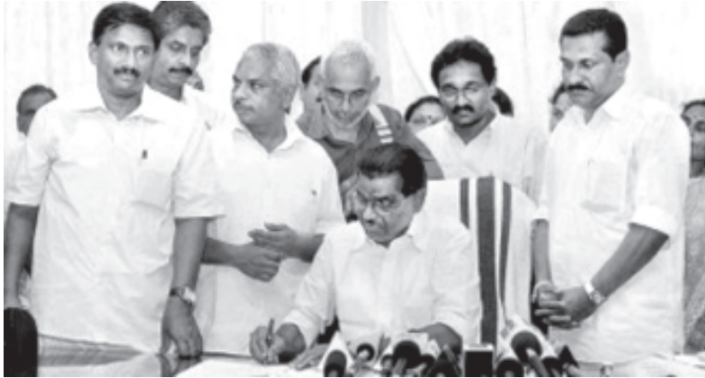
മന്ത്രി തിരുവഞ്ചൂർ രാധാകൃഷ്ണൻ മൂലമ്പിള്ളി പാക്കേജിൽ ഒപ്പുവയ്ക്കുന്നു

കൊടുക്കാൻ കഴിയില്ല. കുടിയൊഴിപ്പിക്കപ്പെട്ടതിനെ തുടർന്ന് മൂലമ്പിള്ളിക്കാർ നടത്തിയ സമരത്തിൽ ഇതല്ലാതെ എന്തായിരുന്നു മറ്റ് സാധ്യതകൾ? ഞാൻ ഒരു സംവാദത്തിന് വേണ്ടി ചോദിക്കുകയാണ്. മേനകയിലെ സമരപന്തലിൽ വച്ച് അവരുടെ ദൈനംദിന ബുദ്ധിമുട്ടുകൾ നേരിൽ കണ്ടിരുന്ന ഒരാളെന്ന നിലയിൽ എന്റെ തീരുമാനങ്ങൾക്ക് ചിലപ്പോൾ സമവായത്തിന്റെ സ്വാഭാവമുണ്ടാകാം. അല്ലാത്ത സാധ്യതകൾ മേനകയിലെ സമരപന്തലിൽ എന്താതിരുന്നവർക്ക് ആലോചിക്കാമായിരുന്നു. കുടിയിറക്കപ്പെട്ടവർക്ക് കയറിക്കിടക്കാൻ ഒരിടമുണ്ടാകുക എന്നതായിരുന്നു അന്ന് എന്റെ മുന്നിലുണ്ടായിരുന്ന പ്രധാന പ്രശ്നം. ഭൂമിയേറ്റെടുക്കുന്ന