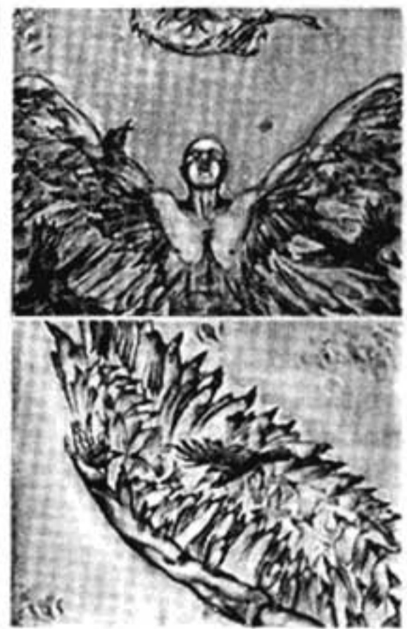
പെയിന്റിംഗ്: ജോസഫ് എം. വർഗ്ഗീസ്