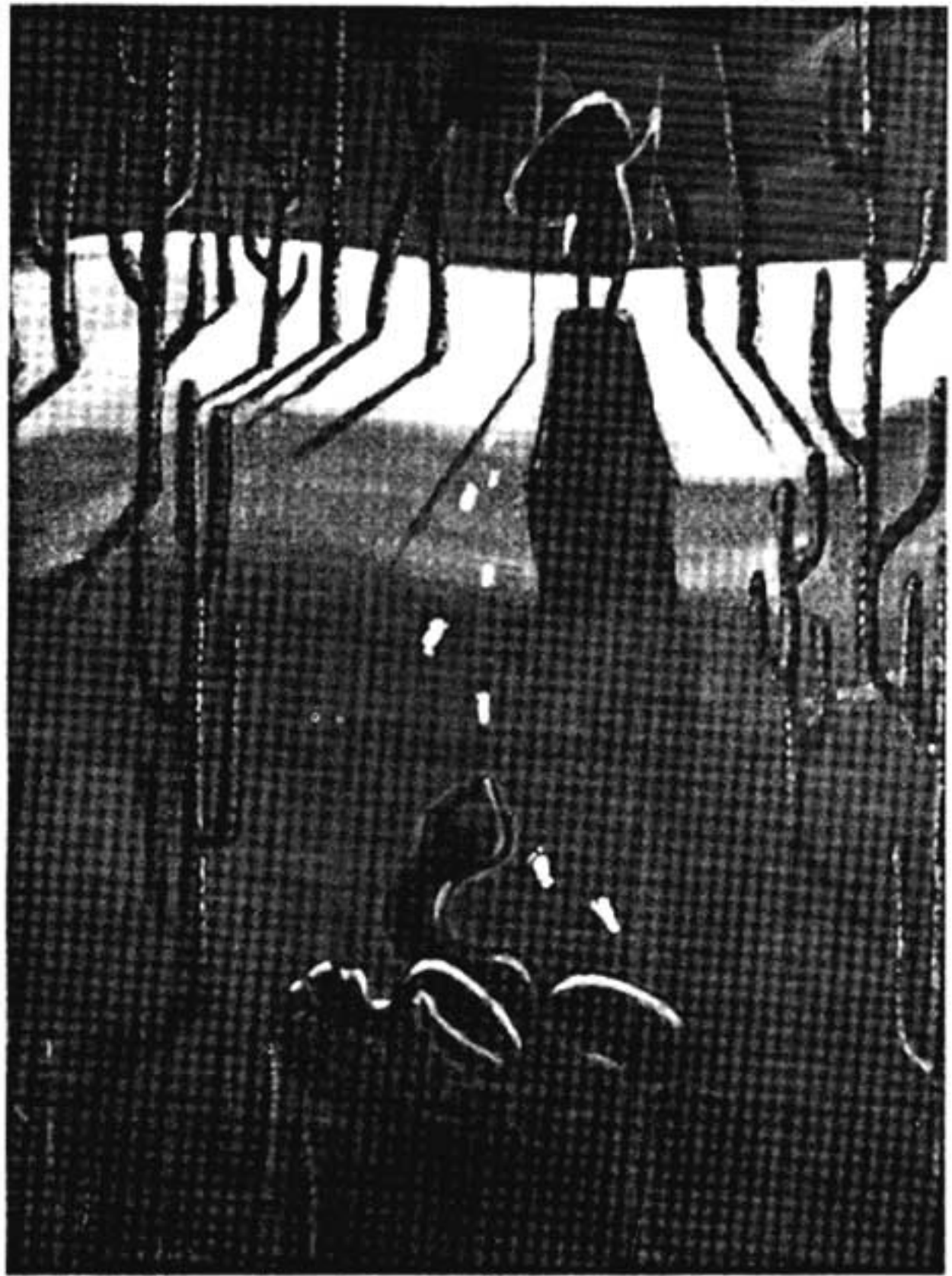
പെയിന്റിങ്ങിന് കടപ്പാട്: പബ്ലിക് ഹെൽത്ത് ചേറാറാ പബ്ലിഷർ

'ഞാൻ' എന്ന് പറയുന്നത് നമ്മളുടെ വേദനയുടെ അറ്റങ്ങളും അതിർത്തികളും നമ്മളുടെ കരണത്തിന്റെ അതിർത്തികളും ആണ്. ദുഃഖവും സങ്കടവുമല്ല ഞാൻ ഉദ്ദേശിക്കുന്നത്. ഞാൻ ഉദ്ദേശിക്കുന്നത് ശാരീരികമായ വേദനയാണ്, ശരീരത്തിന്റെ ബോധനങ്ങൾ (sensations) ആണ്. നമ്മളുടെ കരണത്തിന് വഴങ്ങുന്നത് എന്താണോ അത് നമ്മുടെ സത്വത്തിന്റെ ഭാഗമാണ്. ഇപ്പോൾ എന്റെ വിചാരം കൊണ്ട് എനിയ്ക്ക് ഭൂമിയുടെ വേറൊരു ഭാഗത്തുള്ള എന്തെങ്കിലും പൊക്കാനും താഴ്ത്താനും കഴിയുകയാണെങ്കിൽ ഒരുപക്ഷെ ഞാൻ അത് എന്റെ ഭാഗം ആയിട്ട് കരുതി എന്നുവരും.