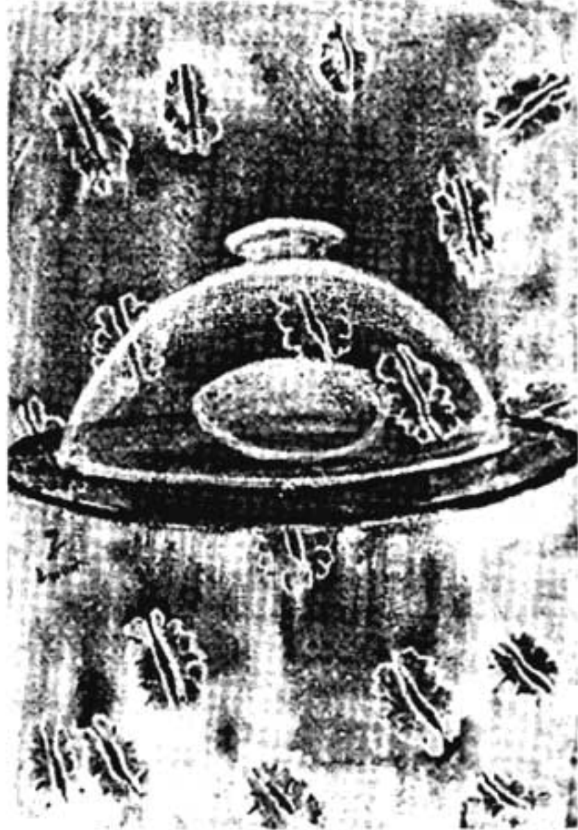
പെയിന്റിംഗ്: ജോസഫ് എ. വർഗ്ഗീസ്

2. ജൈമിതിക രൂപങ്ങളും നിറങ്ങളും ഒക്കെ ജന്മജമാണ്, മനസ്സിലുള്ളതാണ്, എന്നുള്ളത് ഡെക്കാർട്ടിന്റെ (Descartes) ആശയങ്ങളോട് അടുത്തതാണ്, ചോംസ്കി (Chomsky) യുടേയും. ചോംസ്കിയുടെ ഒരു അടിസ്ഥാനാശയം, ഭാഷ അറിയുവാനുള്ള കഴിവ് മനുഷ്യന് ജന്മസിദ്ധമാണ് എന്നുള്ളതാണ്. ഭാഷ പഠിക്കാൻ നമ്മുടെ മനസ്സ് സജ്ജീകരിച്ചിട്ടുണ്ട്, ജനിയ്ക്കുമ്പോൾതന്നെ. അതാണ് ഭാഷയെപ്പറ്റിയുള്ള ചോംസ്കിയുടെ 'ജന്മജനിധാന്തം' (innateness hypothesis).